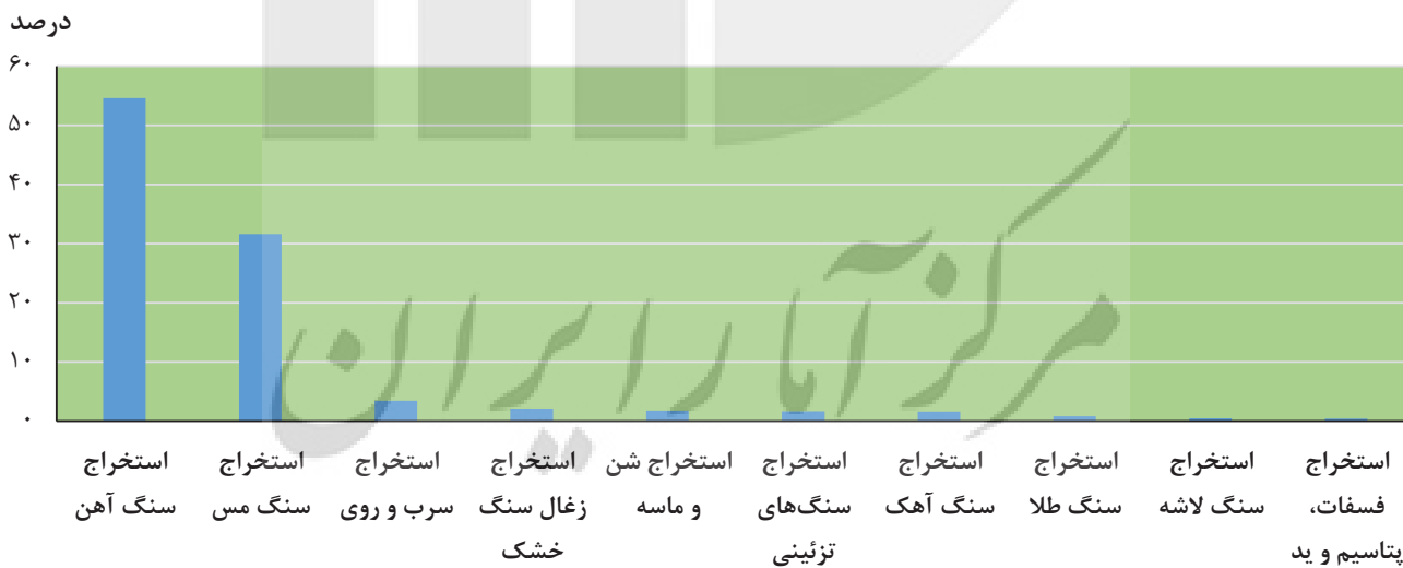
۳-۶ نسبت ارزش افزوده برخی از معادن به کل معادن در حال بهره برداری: ۱۳۹۹