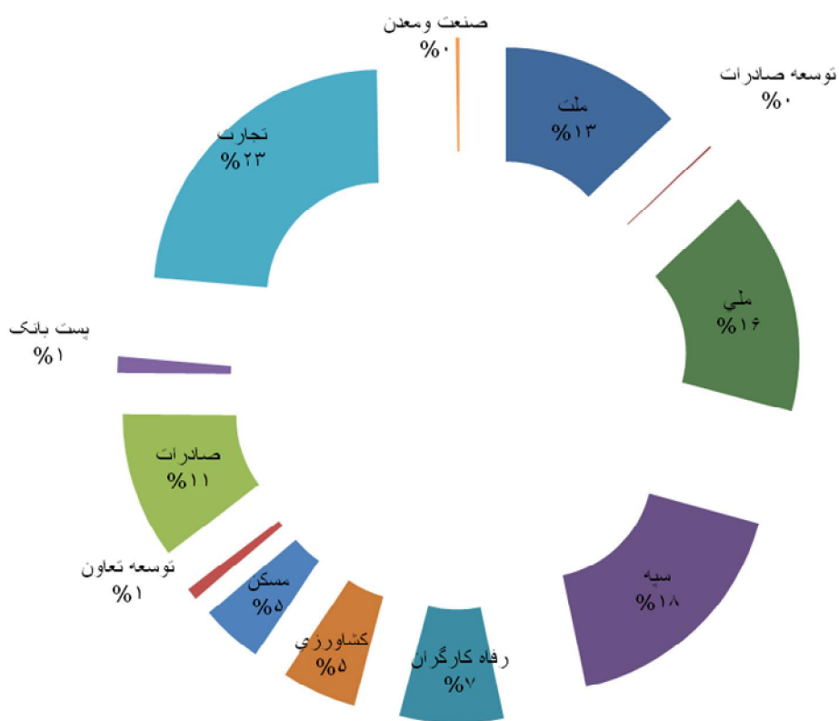
۱-۱۴- مبلغ سپرده های دریافتی بانکهای استان ۱۴۰۰ واحد: درصد