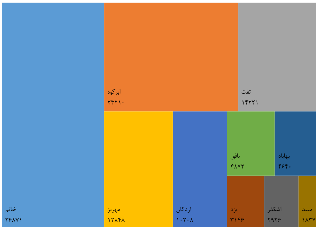
۲-۵- مساحت کل اراضی کشاورزی بهره‌برداری‌های با زمین بر حسب شهرستان: آبان ۱۳۹۳ (هکتار)