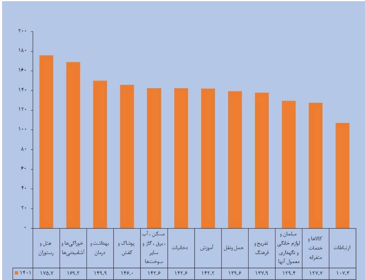
مبنا: جدول ۲-۲۲