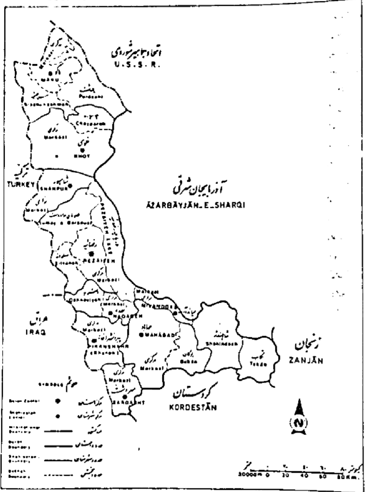
WEST AZERBAIJAN OBIAM BY SHAHRESTAN AND BARNESH