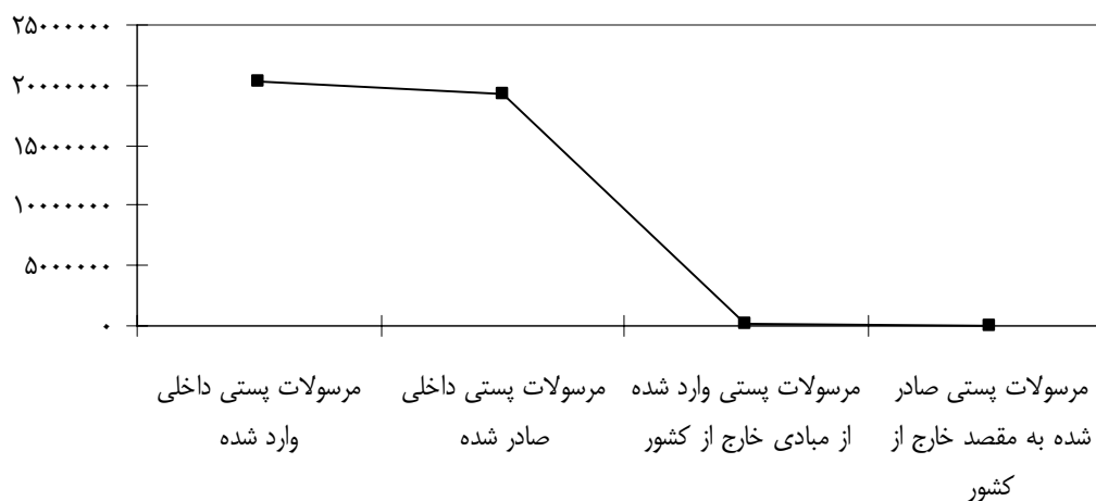
۱۱_۲_ مرسولات پستی استان در سال ۱۳۸۶