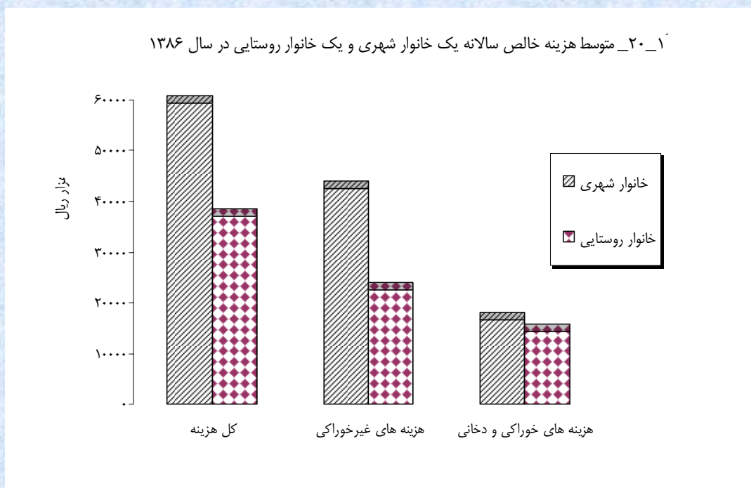
مبنا جدول ۱ _ ۲۰