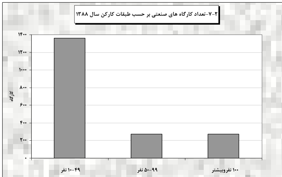
مبنا: جدول ۷-۵