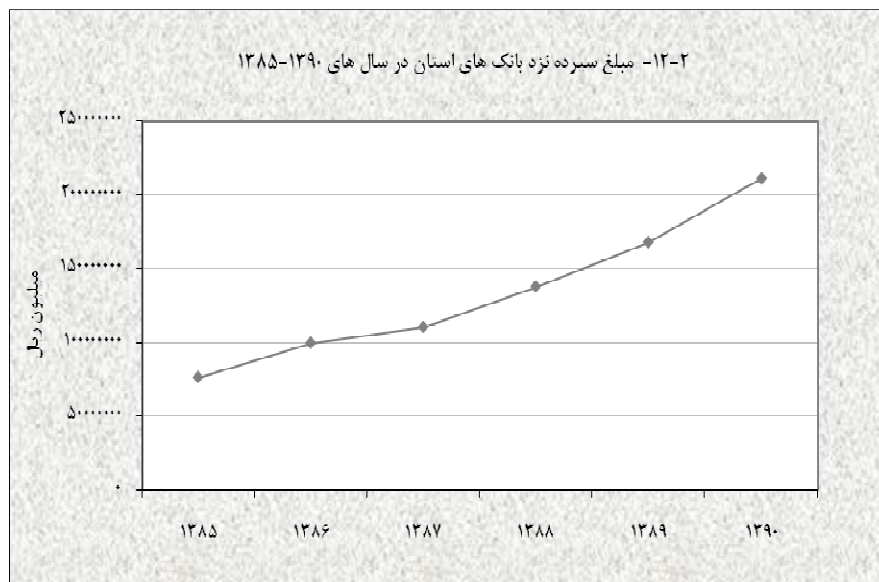
منبع: جدول ۱۲-۴