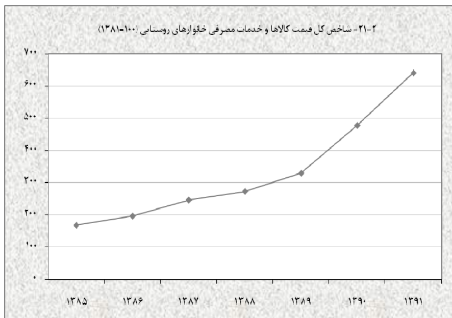
منبع: جدول ۳-۲۱