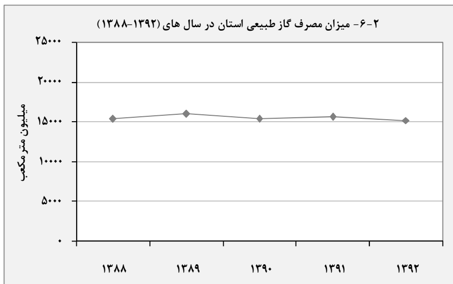
مبنا: جدول ۶-۳