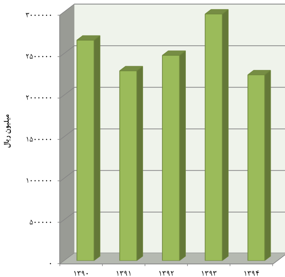
مبنا: جدول ۴-۲۰