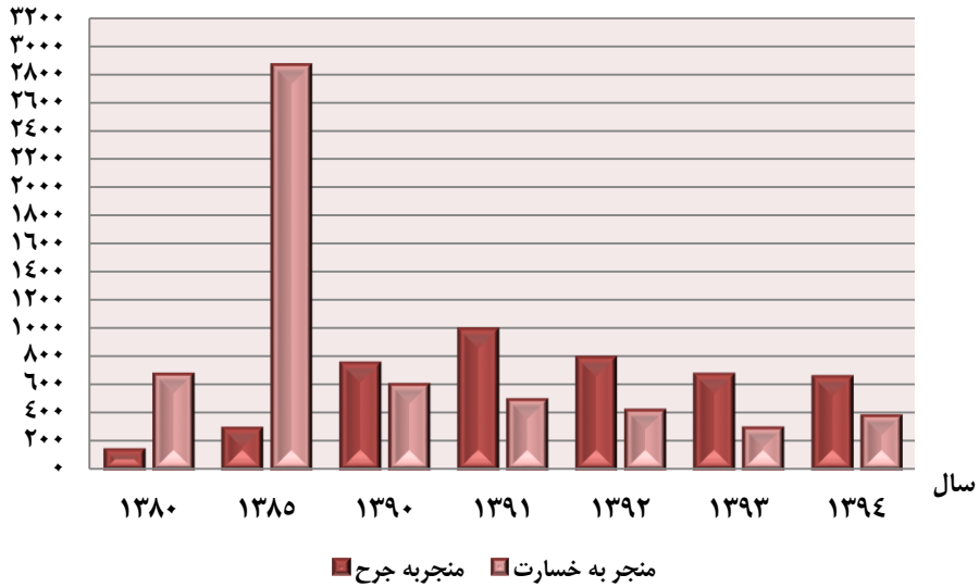
مبنا: جدول ۷-۱۴