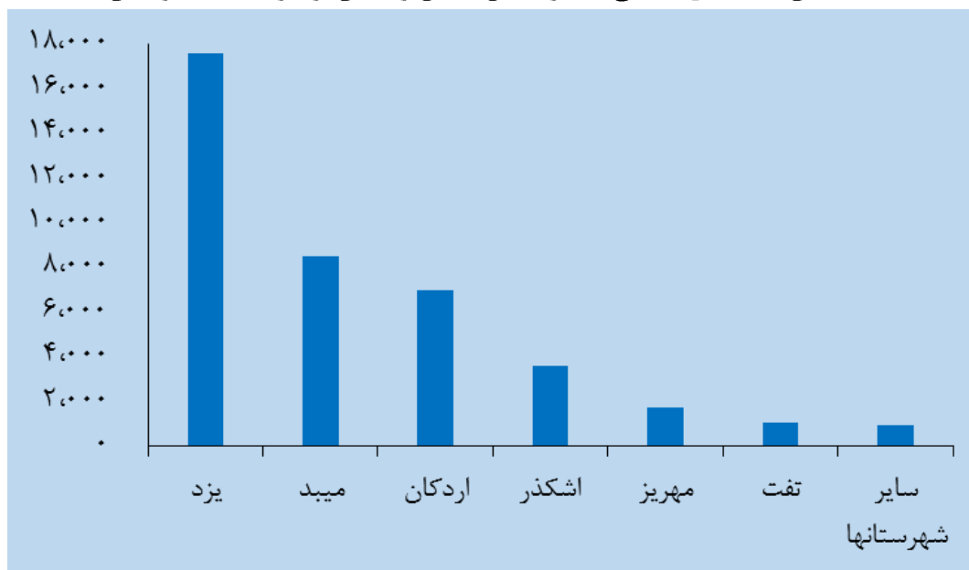
۷-۲- تعداد شاغلان کارگاه‌های صنعتی ۵۰ نفر کارکن و بیش‌تر استان یزد بر حسب شهرستان: ۱۳۹۴