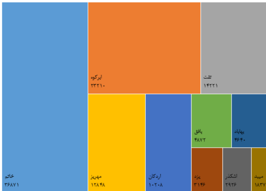
مینا: جدول ۴-۵