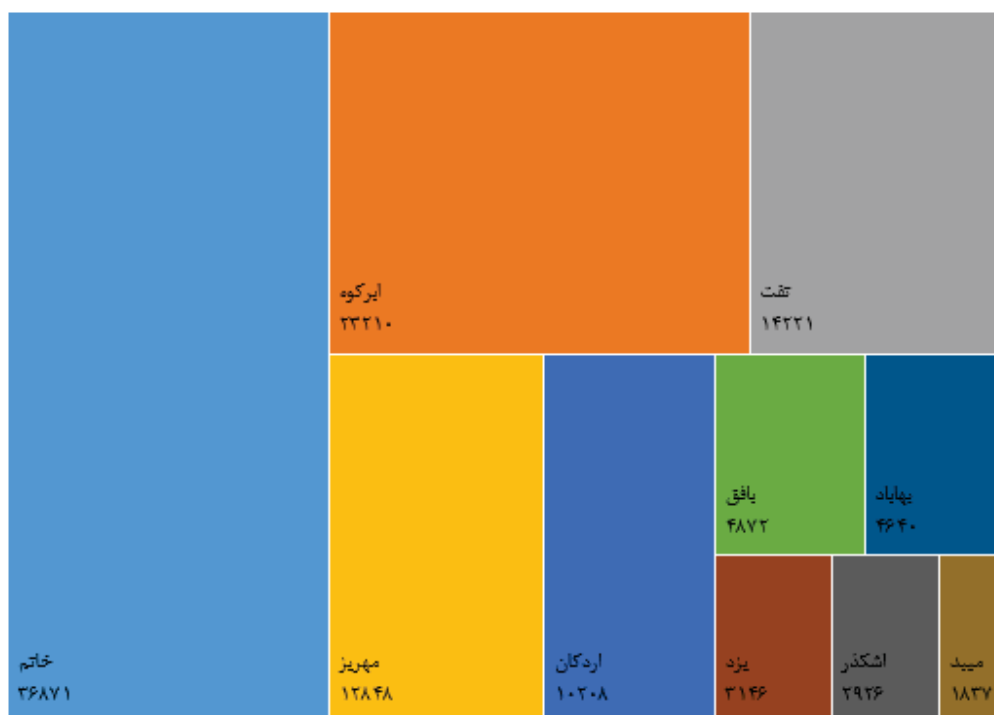
منبع: جدول ۴-۵