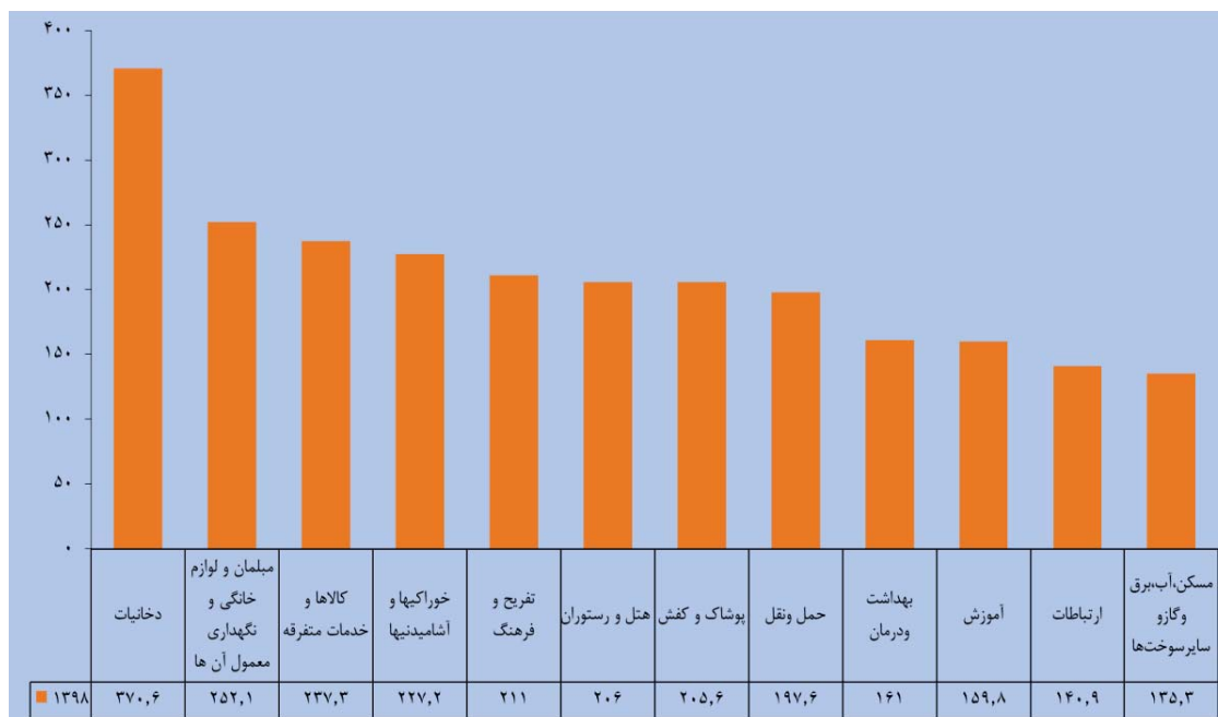
مینا: جدول ۲-۲