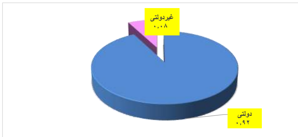
مینا: جدول ۱۸-۴