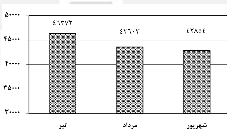
تعداد گوسفند و بره موجود در دامداری‌های کشور - تابستان ۱۳۹۸ (هزار رأس)

بر اساس نتایج حاصل از این طرح آمارگیری، تعداد گوسفند و بره موجود در دامداری‌های کشور در تیر، مرداد و شهریور ماه سال ۱۳۹۸ به ترتیب ۴۶۳۷۲، ۴۳۶۰۳ و ۴۲۸۵۴ هزار رأس برآورد شده است.