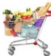
متوسط هزینه کل: ۵ میلیون تومان در ماه