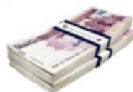
متوسط درآمد کل: ۶ میلیون تومان در ماه