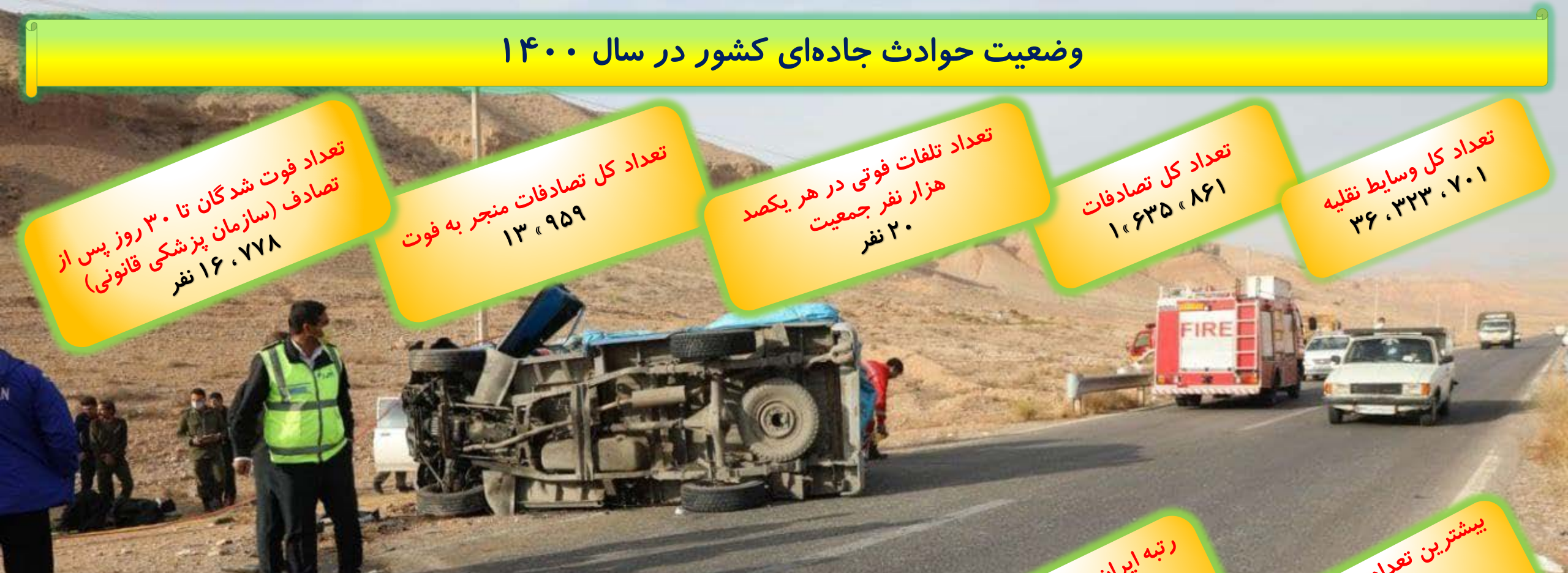
تعداد بیشترین و کمترین متوفی ۵ استان در حوادث جاده‌ای کشور-۱۴۰۰ (نفر)