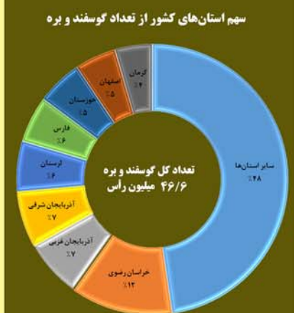
سهم استان‌های کشور از تعداد گوسفند و بره عرضه شده برای کشتار - ۴۶۵ روز منتهی به آبان ۱۳۹۹