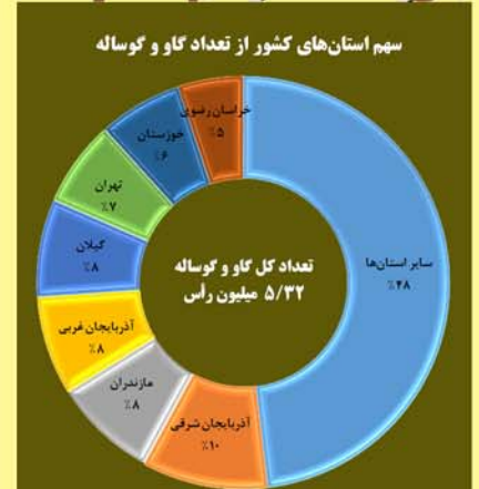
سهم استان‌های کشور از تعداد گاو و گوساله عرضه شده برای کشتار - ۴۶۵ روز منتهی به آبان ۱۳۹۹

با توجه به فصلی بودن زایش دام سبک و مدت پروار آن، تعداد این نوع دام در ماه‌های مختلف متفاوت است. کم‌ترین تعداد مربوط به مهر ماه و بیش‌ترین آن مربوط به اسفند است. اطلاعات تعداد دام این اینفوگرافیک مربوط به آبان ماه است.