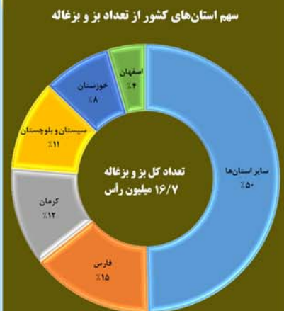
سهم استان‌های کشور از تعداد بز و بزغاله عرضه شده برای کشتار - ۴۶۵ روز منتهی به آبان ۱۳۹۹