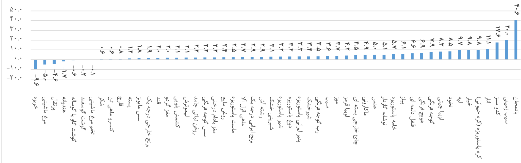
نمودار ۱: درصد تغییر متوسط قیمت ماه جاری نسبت به ماه قبل (دی ۱۴۰۳)

دقیق‌ترین تعریف برای مفهوم «متوسط» یعنی «متوسط قیمت پرداخت شده برای محصولی با کیفیت ثابت». این مفهوم به محصولی کاملاً مشخص (محصولی با مشخصات دقیق و ثابت طی زمان) با ترکیبی از وزن یا مقدار مشخص نیاز دارد. این هدف تنها با داده‌های اسکنری قابل دسترسی است. در این گزارش از قیمت‌هایی که برای محاسبه شاخص قیمت مصرف‌کننده جمع‌آوری می‌شوند، استفاده شده است. این قیمت‌ها طیف وسیعی از یک محصول با کیفیت‌های متفاوت را شامل می‌شود.