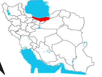
موقعیت استان در کشور

استان: مازندران شهرستان: آمل بخش: مرکزی دهستان: پائین خیابان لیتکوه مقیاس: ۱ : ۵۰۰۰۰