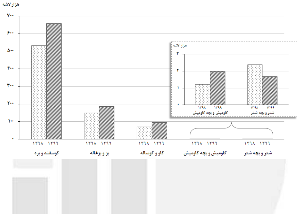
مقایسه وزن لاشه‌های قابل مصرف انواع دام ذبح‌شده در کشتارگاه‌های کشور در ماه آذر ۱۳۹۸ و ۱۳۹۹