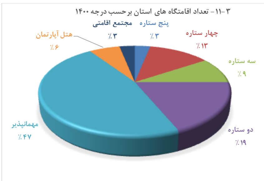
مبنا: جدول ۱۱-۱۱