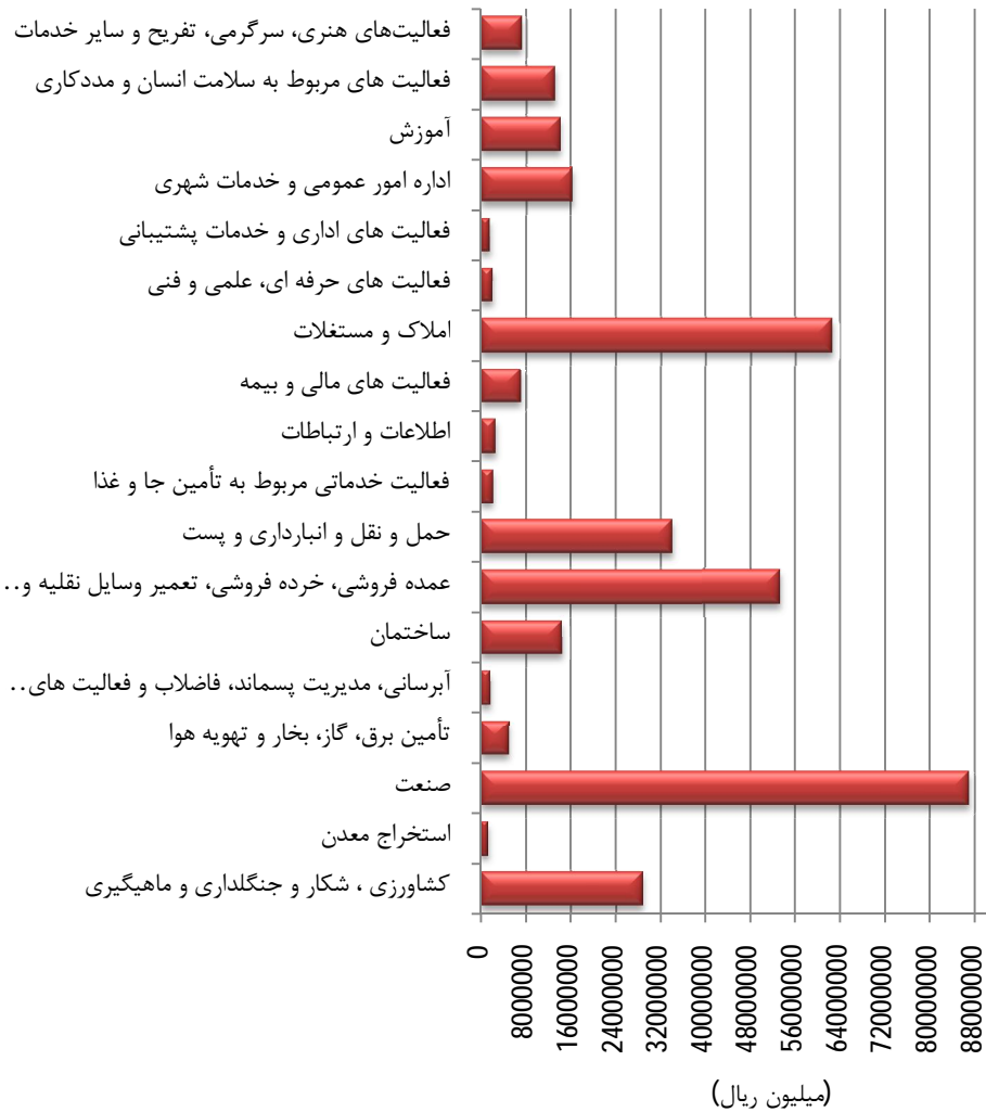
مبنا: جدول 23-1