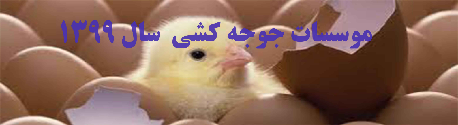
تعداد موسسات جوجه کشی بر حسب استان ۱۳۹۹: ۱۳۴ واحد