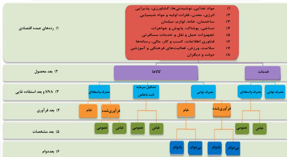
شکل ۲- ارتباطات نسخه پنجم BEC