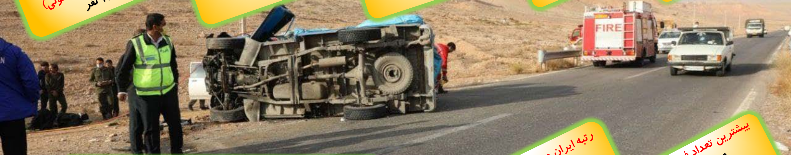
تعداد بیشترین و کمترین متوفی ۵ استان در حوادث جاده‌ای کشور-۱۴۰۰ (نفر)