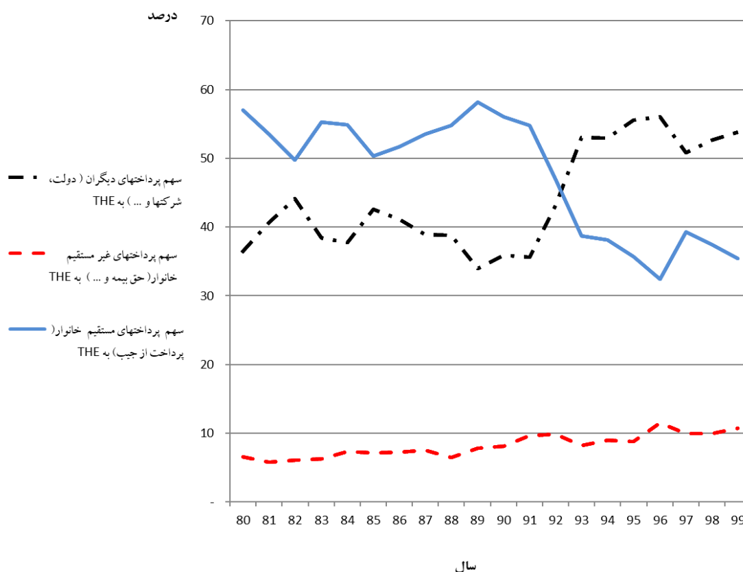
شکل ۲- سهم منابع تامین مالی سلامت در کل هزینه های سلامت ۹۹-۱۳۸۰ (Total Health Expenditure - THE)

شکل ۲ نشان می دهد که سهم پرداخت از جیب خانوار از ۵۶/۹۷ درصد در سال ۱۳۸۰ پس از فراز و نشیب های بسیار در سال ۱۳۹۹ به ۳۴/۹۸ درصد می رسد یعنی طی ۱۸ سال معادل ۲۱/۹۹ درصد کاهش یافته است، در مقابل، ۱۷/۹۲ درصد سهم پرداخت های دیگران یعنی دولت و شرکت ها و ۴/۰۷ درصد سهم پرداختهای غیر مستقیم خانوار افزایش یافته است.