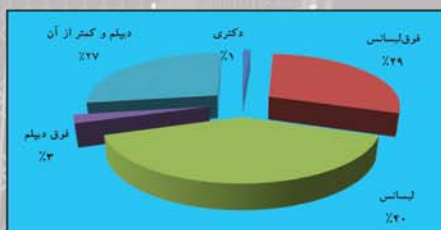
نمودار ۳- نیروی انسانی مرکز آمار ایران به تفکیک مدارک تحصیلی