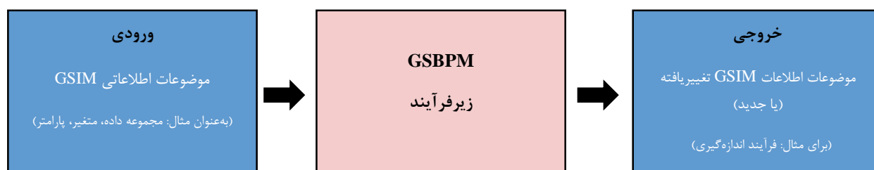
شکل ۲- موضوعات اطلاعات GSIM به‌عنوان ورودی و خروجی زیرفرآیند GSBPM

۳۰- GSIM و GSBPM مدل‌های مکمل تولید و مدیریت اطلاعات آماری هستند. همان‌طور که در شکل ۲ در زیر نشان داده شده است، GSIM با تعریف موضوعات اطلاعاتی که بین آن‌ها جریان دارد و در آن‌ها ایجاد می‌شود و برای تولید آمار رسمی از آن‌ها استفاده می‌شود، به توصیف زیرفرآیندهای GSBPM کمک می‌کند. ورودی‌ها و خروجی‌ها را می‌توان بر اساس موضوعات اطلاعات تعریف کرد و در GSIM رسمیت پیدا کند.