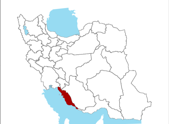
موقعیت دهستان در استان